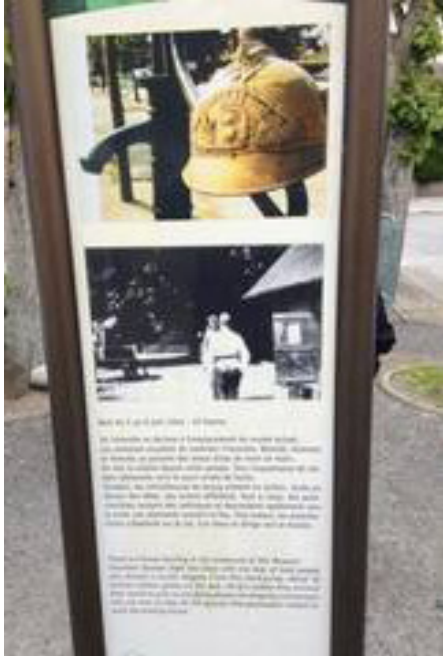
Casque des pompiers de St Mère l'Eglise.

Intervention des sapeurs pompiers de la communes.