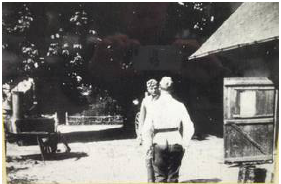
Photo des pompiers.