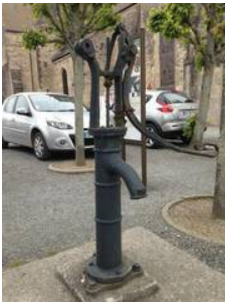
La pompe à eau de la ville qui a alimenté la pompe à bras des sapeurs pompiers.